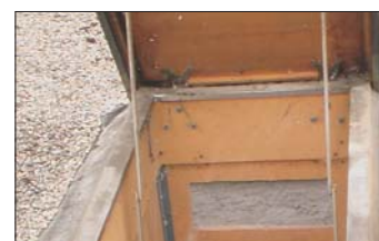
Zusätzliche Einblasöffnungen garantieren optimale Dämmstoffverteilung.

Bei der Montage arbeiten Dachdecker und Dämmprofi Hand in Hand: Kurz vor dem Ausflocken wird die Einblasöffnung in das Dach geschnitten. Sofort nach dem Dämmen verschweißt der Handwerker diese Öffnung wieder fachgerecht.