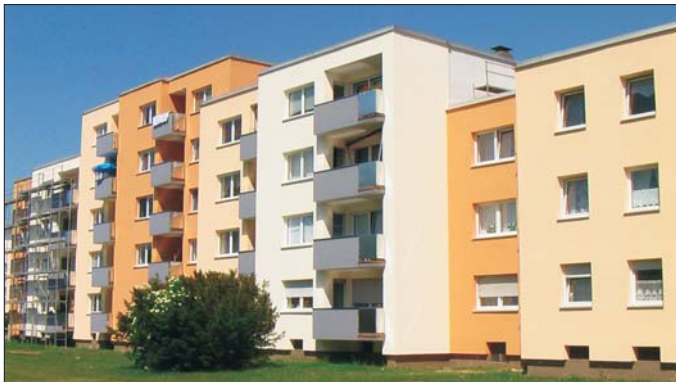
Altdorf: Energetisch saniert und optisch ansprechend präsentiert sich die generalsanierte Wohnanlage der GWNdb/Opf.

Altdorf: Das unzugängliche Flachdach der Wohnanlage aus den 70er Jahren mit einem Deckenhohlraum von ca. 40 cm lichter Höhe war schnell gedämmt. Dabei wurden nicht nur Montagekosten gespart, sondern auch die gesetzlichen Auflagen spielend erfüllt.