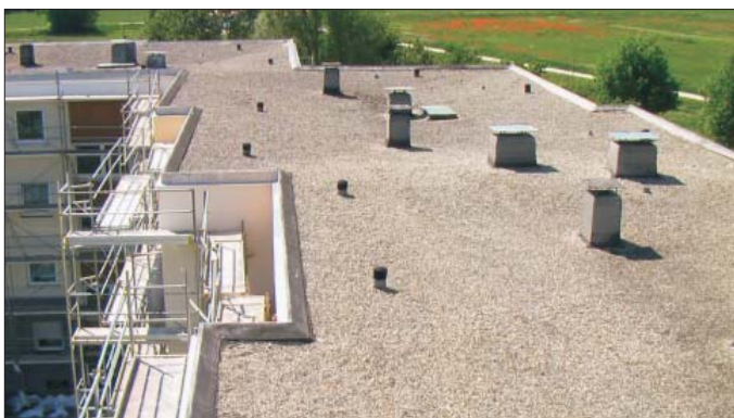
Häufig anzutreffen: Bekieste Bitumendächer mit Lüftern und Kaminen erschweren den Zugang zum Dämmhohlraum.

Daher kann es nicht verwundern, dass isofloc diese Dämmaufgabe enorm kostengünstig gemeistert hat.