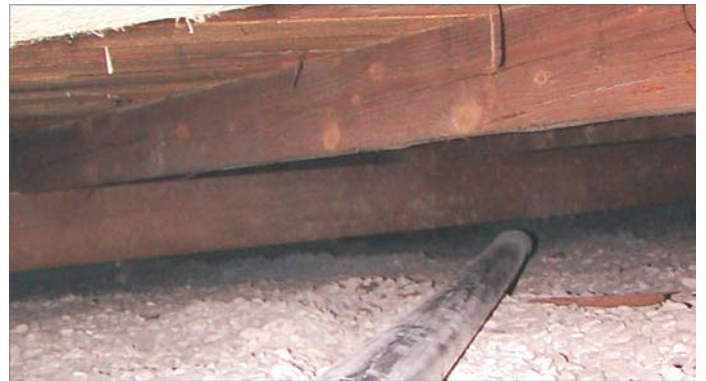
Der pneumatische Transport von isofloc garantiert eine schnelle und sichere Verteilung des Dämmstoffes im Hohlraum.

Der alte U-Wert von 0,80 [W/qmK] wurde durch das Einblasen von isofloc auf 0,13 [W/qmK] verbessert - der Dämmwert also versechsfacht. Die gesetzlichen Auflagen der Energie-Einspar-Verordnung (EnEV) sind damit spielend erfüllt.