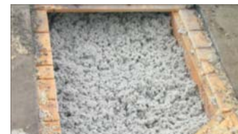
Gleichmäßige Dämmschicht