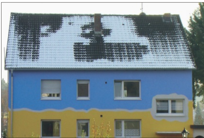
Der Beweis für teuren Wärmeverlust: Abgetaute Stellen auf dem Dach

Schlecht gedämmte Dächer sind mit bloßem Auge erkennbar: Wenn es leicht geschneit hat oder der Frost seinen Raureif auf die Dacheindeckung gelegt hat, zeigen die abgetauten Stellen, dass hier eine Menge Geld zum Dach hinaus geheizt wird. Die abgeschmolzenen Flecken sind der sichere Beweis, dass die teure Heizenergie die Dachhaut übermäßig erwärmt. Hohe Wärmeverluste sind die Folge.