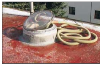
Dämmen per Schlauchleitung

Systembedingt bietet isofloc bei solchen Voraussetzungen ein paar wichtige Montagevorteile, die es ermöglichen, diese Hohlräume sicher, schnell und fugenfrei zu dämmen: