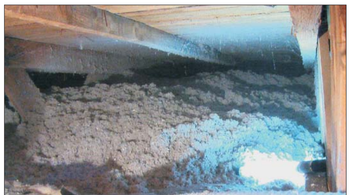
Über 20cm dicke Dämmung garantiert Behaglichkeit und niedrige Heizkosten

Der alte U-Wert von ca. 0,60 [W/qmK] wurde durch das Aufblasen von isofloc auf 0,11 [W/qmK] verbessert - der Dämmwert also mehr als verfünffacht. Deutlich optimiert wurde auch der sommerliche Hitzeschutz.