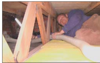
Sicher, schnell und fugenfrei