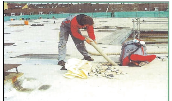
Mehrfamilienhaus von 1970, zweischaliges Flachdach. Geschätzte Amortisationszeit ca. 3,5 Jahre